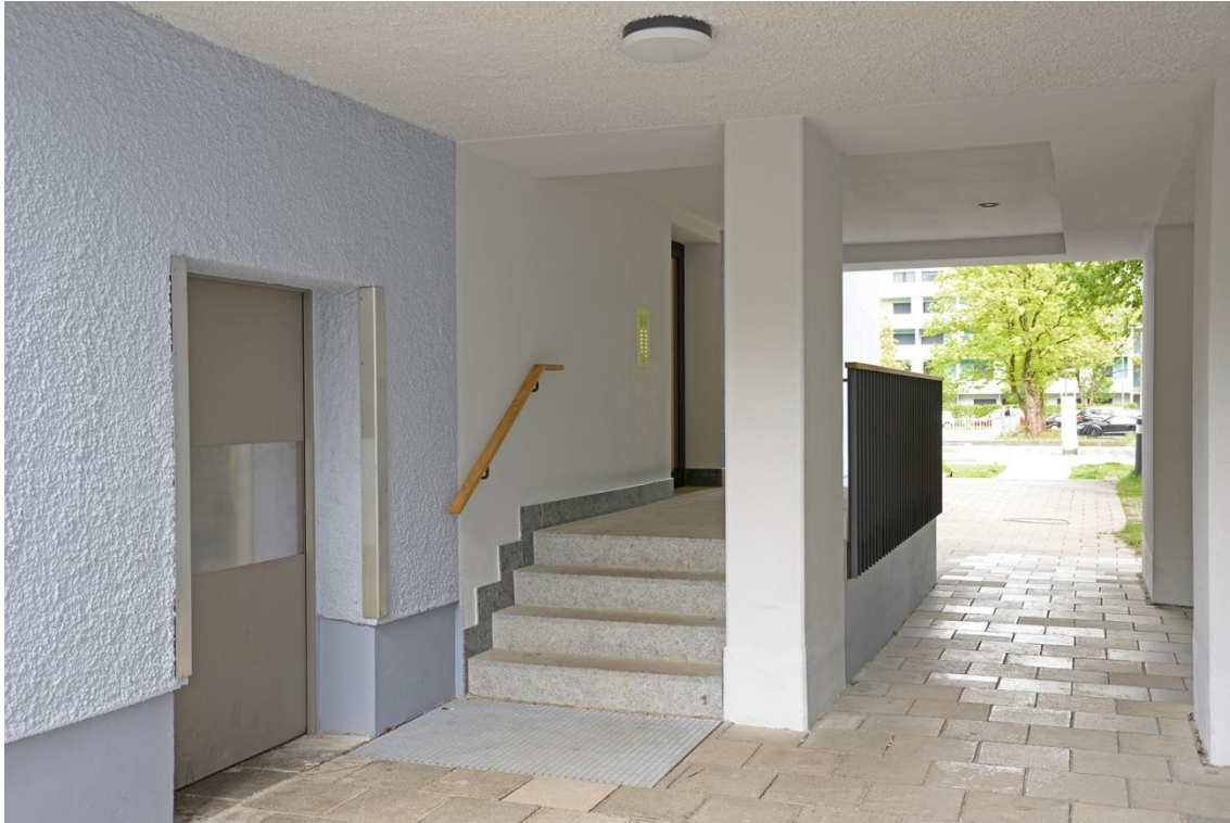
Sanierter Eingangs- und Durchgangsbereich mit Betonstützen